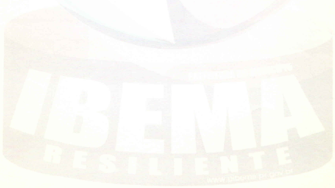
2017/2020 ADELAR ANTONIO ARROSI PREFEITO MUNICIPAL