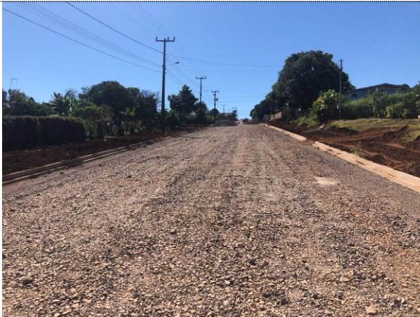
01 – Meio-fio