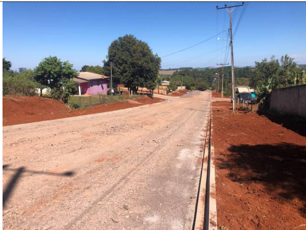
3 – Brita 4A