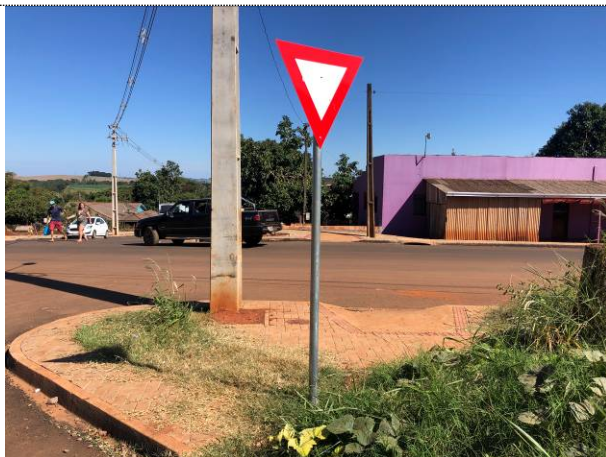
1- Sinalização vertical