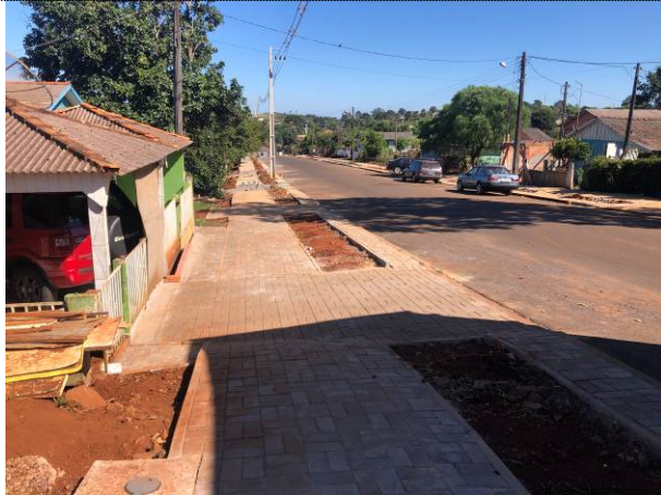
03 – Paver em acessos e passeio