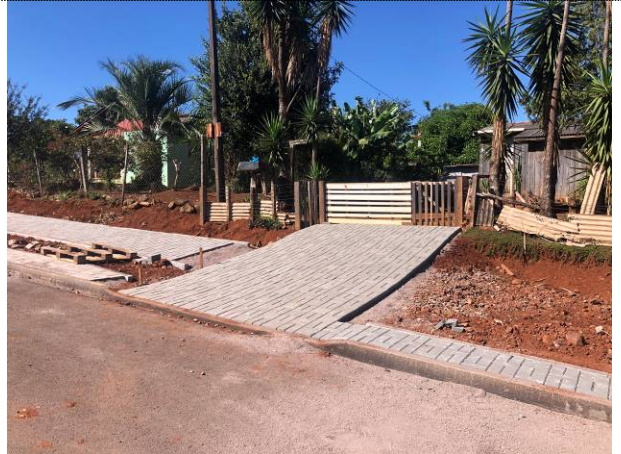
04 – Paver em acessos de veículos e passeio