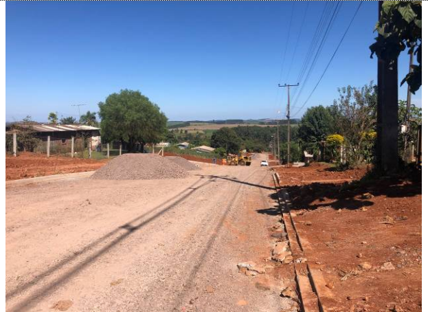
2 – Brita 4A