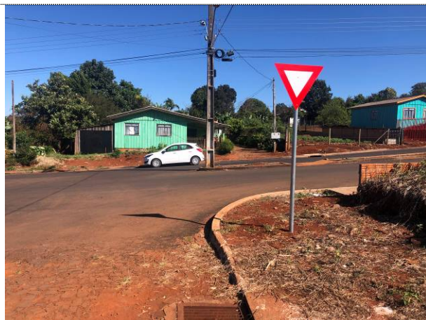
9 - Sinalização vertical