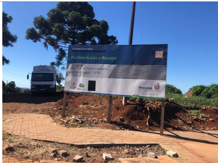
1 – Placa da obra