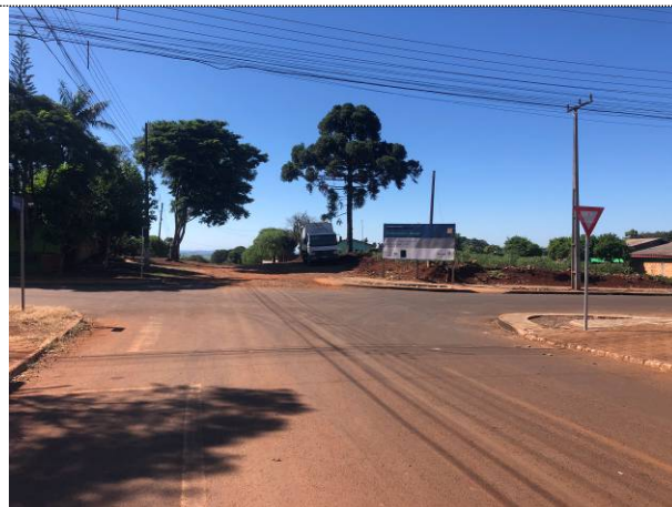
2 - Sinalização vertical