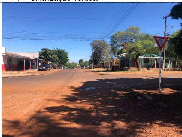
3 – Sinalização vertical