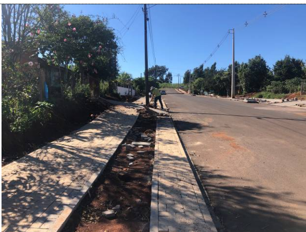
01 – Paver de 4 cm no passeio