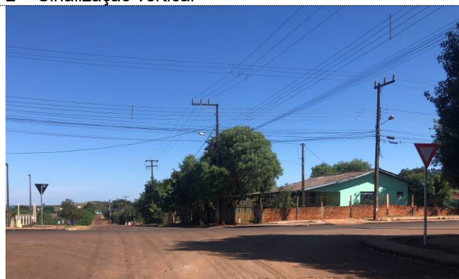
4- Sinalização vertical