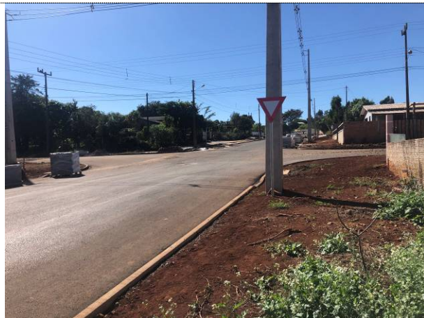
7 - Sinalização vertical