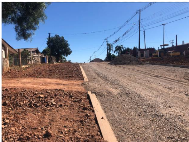
4 – Brita 4A