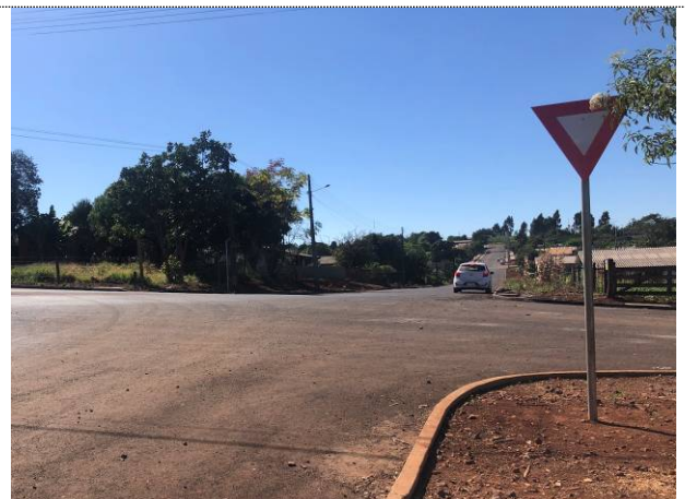
10 - Sinalização vertical