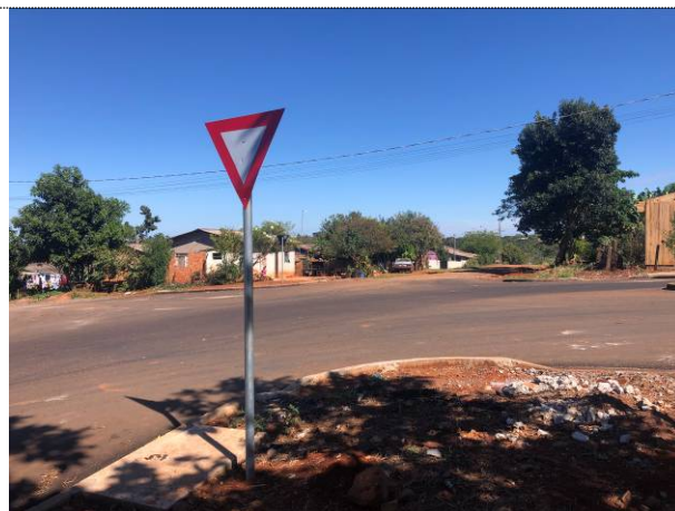
6 - Sinalização vertical