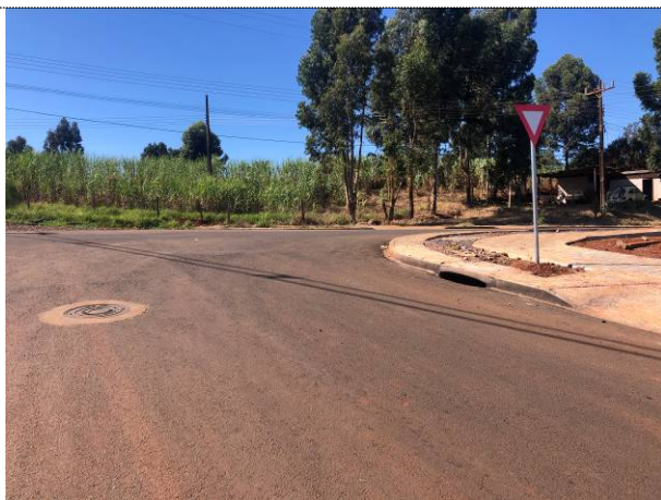
5 – Sinalização vertical