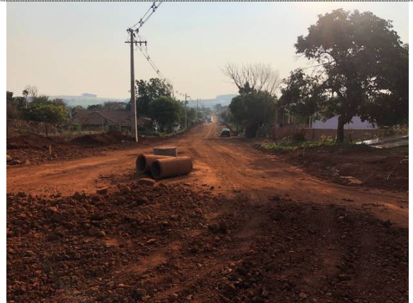
19- Poço de visita na Rua Pernambuco