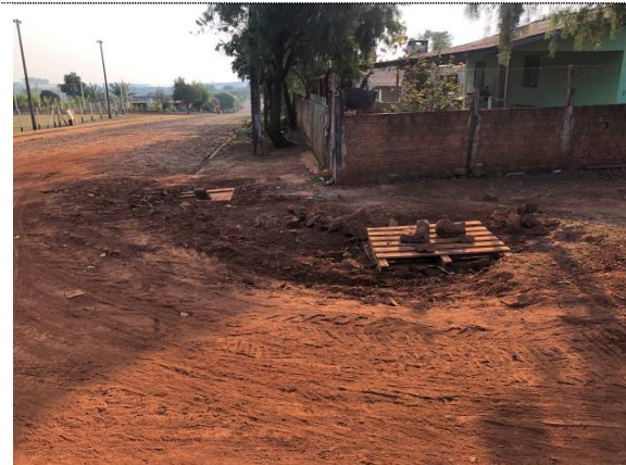
22 - BI na rua Apucarana esq. Rua Paraíba