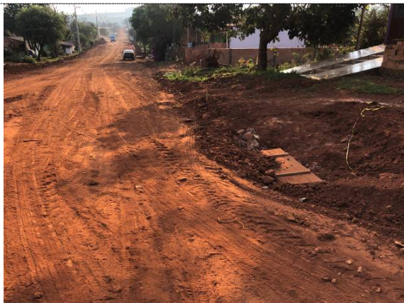
4- Remoção da camada superficial na Pernambuco