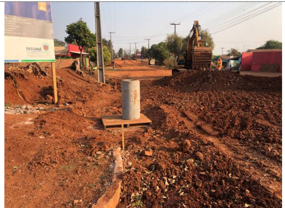
21 - BL do aditivo na Rua Apucarana