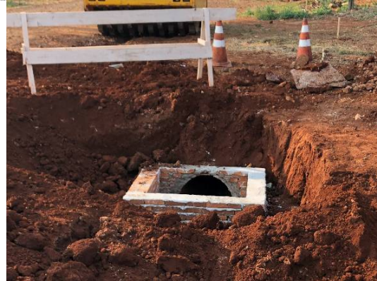
27 – BL na Maringa esq. Pernambuco