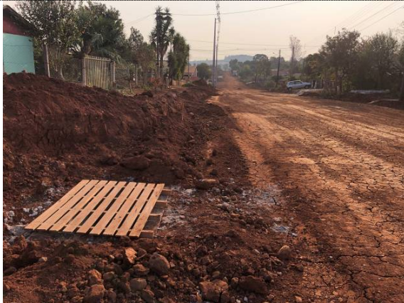
14- BL executada na Rua Pernambuco