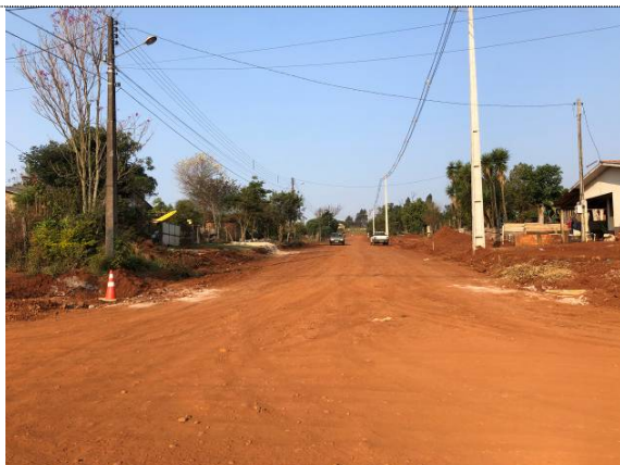
6 - Remoção da camada superficial na Pernambuco