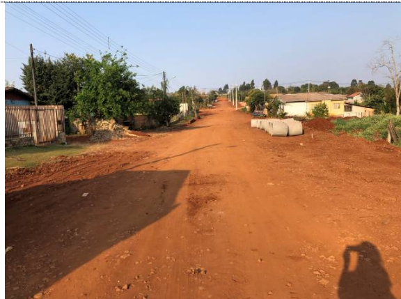
2- Remoção da camada superficial na Pernambuco