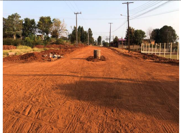
25- Poço de visita da rua Apucarana