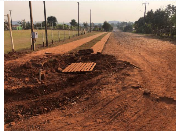
20 - BL na rua Apucarana esq. rua Paraíba