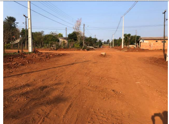
3- Remoção da camada superficial na Pernambuco