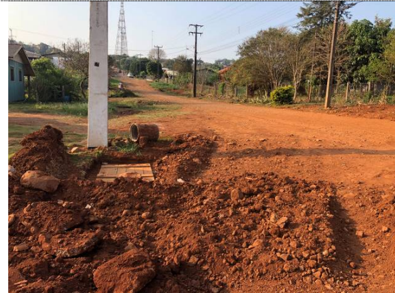
18- BL na Rua Mandaguari