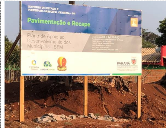
1 - Placa de obra na Rua Apucarana