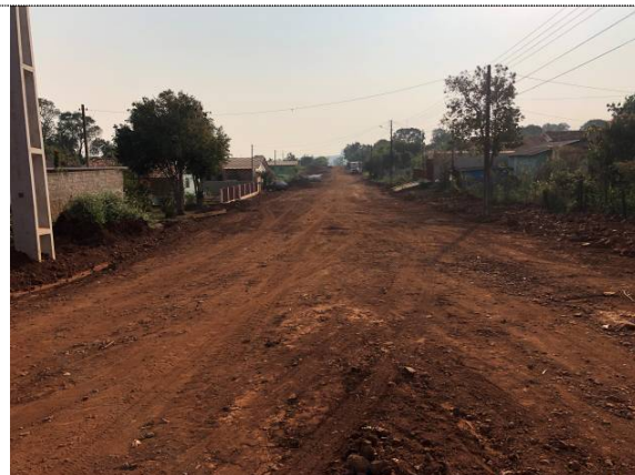
5- Remoção da camada superficial na Pernambuco