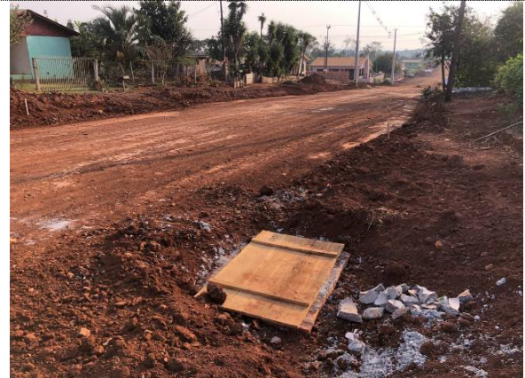
15- Boca de lobo na Pernambuco