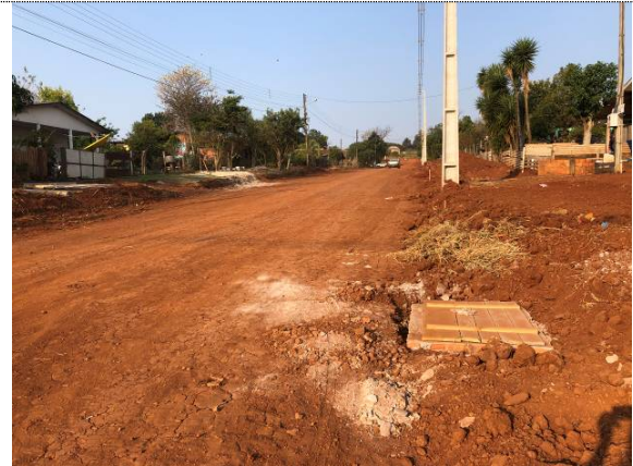
17- BL na Rua Pernambuco esq. Rua Mandaguari