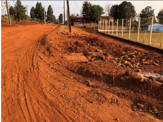
24-BL na rua Apucarana