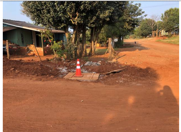
23-BL na Rua Apucarana esq. com a Paraíba