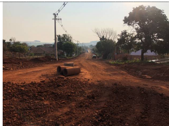
7- Remoção da camada superficial na Pernambuco