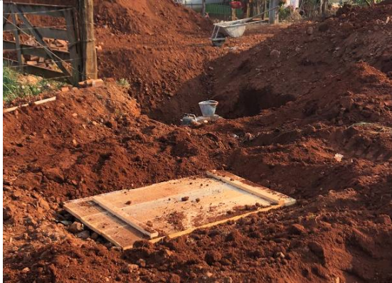
26 – BL na Rua Maringa esq. Rua Pernambuco