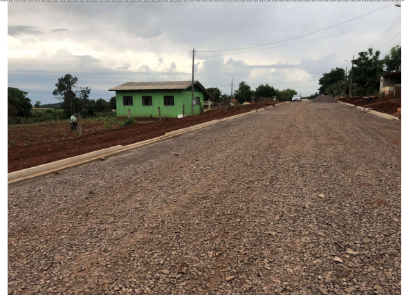
6 – Execução do meio-fio e regularização para calçada