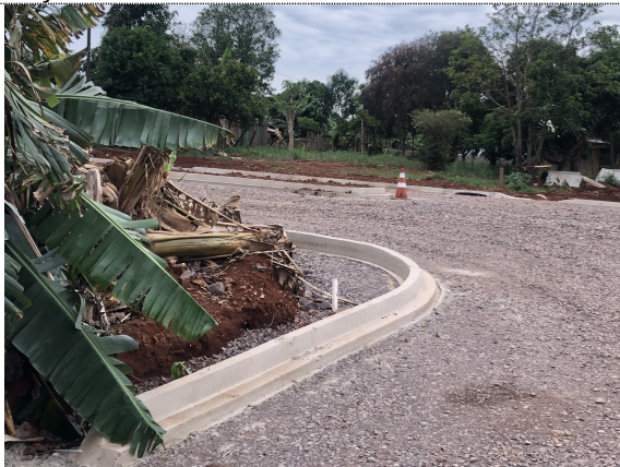
7 – Execução do meio-fio e regularização para