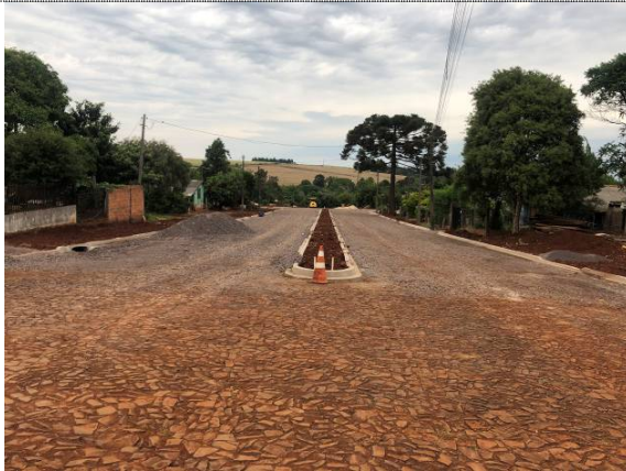
3 – Meio-fio da Rua Maringá entre a Paraíba e a Pernambuco