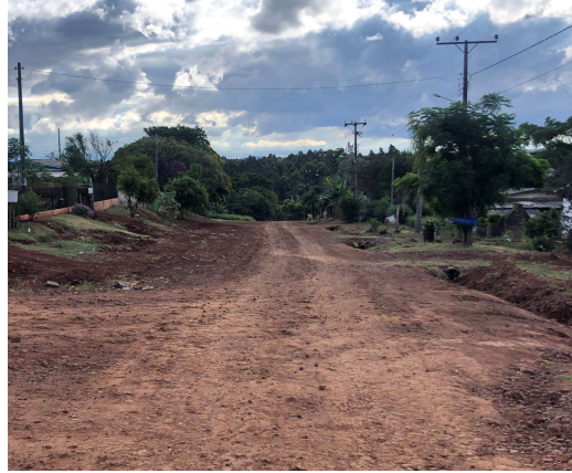
3 – Remoção