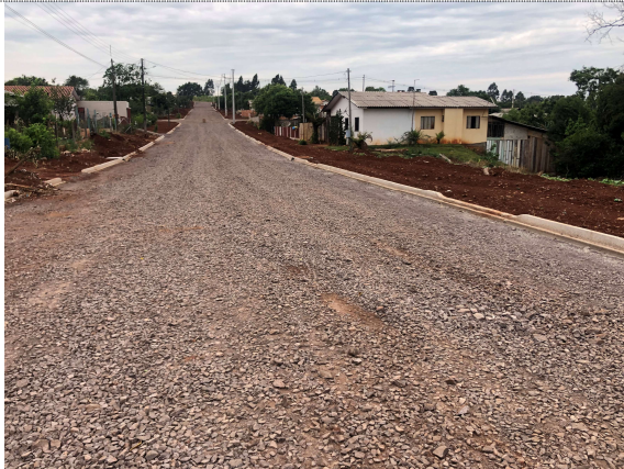
5 – Execução do meio-fio e regularização para calçada