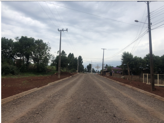
11 – Execução do meio-fio e regularização para calçada