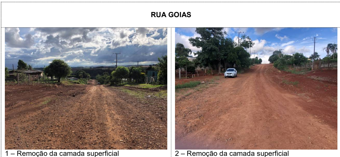
1 – Remoção da camada superficial