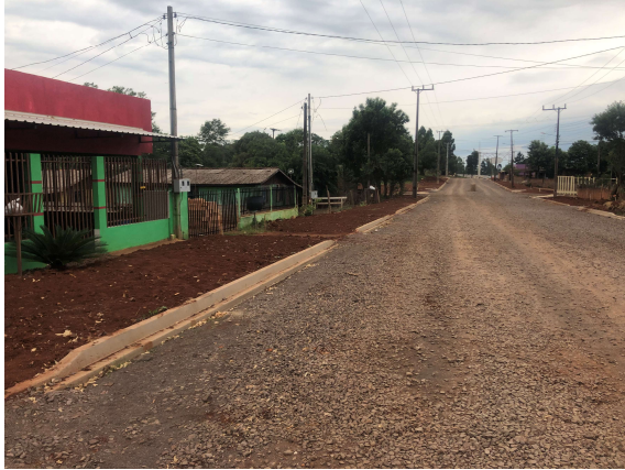
9 – Execução do meio-fio e regularização para calçada