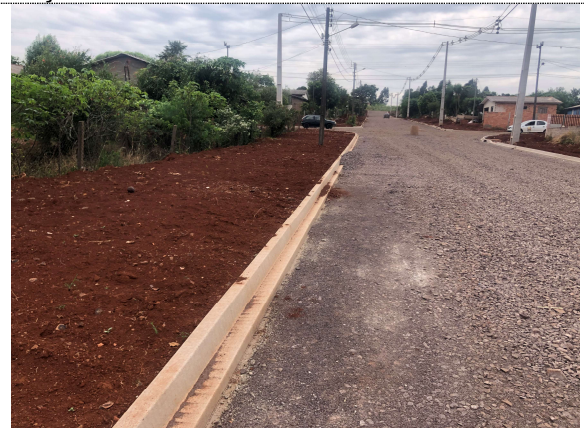
8 – Regularização para calçada