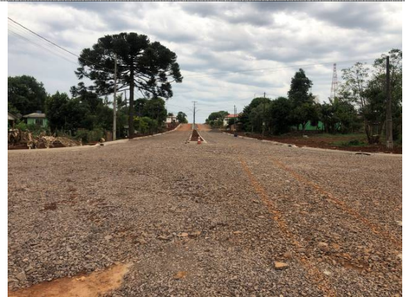
4 – Meio-fio do canteiro central na Rua Maringá