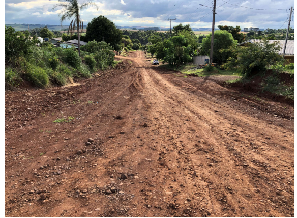
4 – Remoção da camada