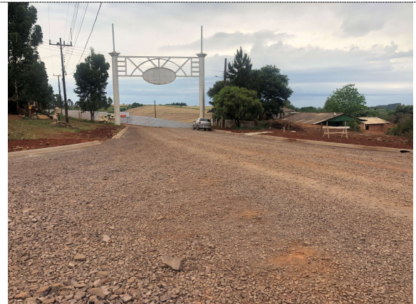
12 – Execução do meio-fio e regularização para calçada