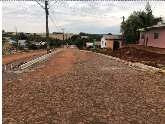
1 – Meio-fio executado na Rua Maringá