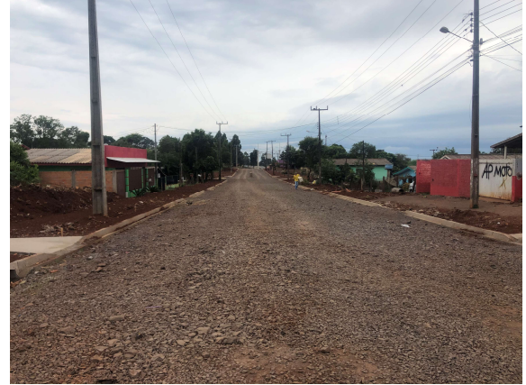
10 – Execução do meio-fio e regularização para calçada