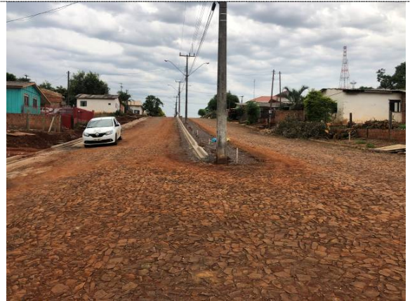
2 – Remoção de meio-fio e árvores e execução de meio-fio